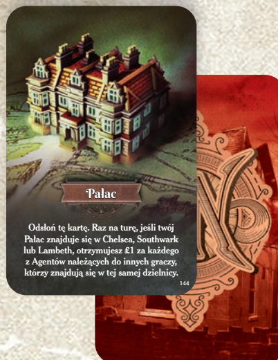
przykład karty Budynku

Nie wyjawiaj nikomu swoich kart Agentów, dopóki ich nie zagrasz. Możesz używać zdolności tych kart w dowolnej chwili podczas swojej tury (tak jak z umiejętnościami kart Dzielnic). Niektóre z tych zdolności to Akcje, których możesz użyć tylko raz, niektóre mają stale działający efekt, a niektóre są Reakcjami. Dokładne opisy zdolności znajdują się na kartach.