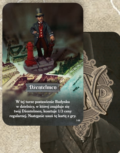
przykład karty Agenta

Podczas rozkładania gry, zanim gracze zaczną rozmieszczać swoje figurki na planszy, potasuj talię kart Agentów i rozdaj po 3 każdemu z graczy 8A . Jeśli jakieś zostały, odłóż je do pudełka zakryte. Następnie potasuj talię kart Budynków i rozdaj po 1 każdemu z graczy 8B . Resztę odłóż zakryte obok planszy 8C . Każdy gracz musi się teraz zastanowić, jakie figurki Agentów rozmieścić na planszy w ustawieniu początkowym.