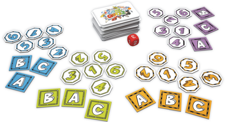
przykładowe rozłożenie gry dla 4 graczy

WRAZ Z UPŁYWEM CZASU ZALECAMY NIE ZADAWAĆ PYTAŃ O ŚREDNIEJ WARTOŚCI, A JEDYNIEMO O WARTOŚCI NAJWYŻSZEJ BĄDŹ NAJNIŻSZEJ.